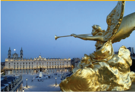
Nancy Place Stanislas (Patrimoine mondial de l'UNESCO)